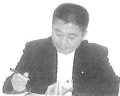
熱心に問題点をメモする橋本勉衆議院議員